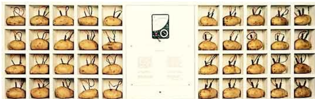
Analogía I. 1970/1971.

Influenciado por las vanguardias históricas, Grippo plantea una nueva forma de hacer y, con ella, un nuevo lugar para el artista y su función social en el tejido social contemporáneo. Como consecuencia, propone también una nueva forma de ciencia y de técnica y, más profundamente, un nuevo modo de conocer que alcance aquello que la ciencia ignora. Grippo trabaja con las técnicas de la industria y las formas de la ciencia moderna pero su modus operandi es más el del alquimista que busca develar lo oculto en la materia. Su vuelta a lo sagrado y su encuentro con la alquimia expresa una “poética tecnológica” que, como hemos afirmado en otra parte, “combina saberes y tecnologías de base científica con saberes y tecnologías no científicas o para-científicas: liturgias religiosas, exploración de estados de conciencia y concepciones holísticas”. 7