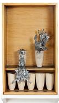
Ascenso y descenso de una misma cosa, 1980.

Tanto en lo formal como en lo conceptual, Grippo denota una triple relación arte, ciencia y técnica. En relación a la ciencia, su trabajo señala las formas del laboratorio, de la observación y de la clasificación. Con sus valijitas y cajas, Grippo creó un conjunto de obras que funcionan como dispositivos de exhibición ideados para presentar diversos materiales y elementos que, en muchos casos, recuerdan al museo de ciencias que selecciona, etiqueta y exhibe objetos. También aparece la construcción de escenarios de experimentos o pequeños “fenómenos” como son las obras que componen la Serie Equilibrios. En ellos, el artista, como el científico, explora el mundo, formula leyes y establece o re-establece un orden.