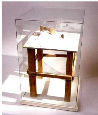
Algunos oficios, 1976.

El arte, la técnica y la ciencia, se emparentan para Grippo en una aspiración común: la de conocer y transformar el mundo. Para Grippo, arte, técnica y ciencia debieran volver a estar íntimamente relacionadas entre sí, y el rol social del artista, el técnico y el científico borrar las contradicciones actuales. En esta dirección, humanizar la técnica y sociabilizar el arte -en el sentido de volverlo cotidiano, cercano a la vida- son premisas bastante acertadas para comprender gran parte de su trabajo. Una visión humanista que, lejos de la separación moderna, reclama la reunificación y el borrado de ciertas fronteras en las que arte, ciencia y técnica dejen de estar separadas.