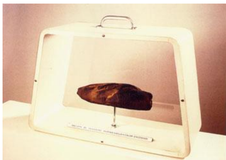
Valijita de panadero (Homenaje a Marcel Duchamp), 1977.